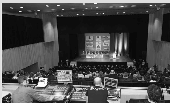
L'Espai Ter, ple de gom a gom, durant el Congrés de Penyes Barcelonistes, que va organitzar la Penya Barcelonista Montgrí i Comarca el 29 de març de 2015.

L'Espai Ter va néixer, no només com un gran aparador cultural en la música i en les arts escèniques, sinó també com un pol de promoció del territori i un lloc de referència en els camps dels congressos, esdeveniments i fires, amb l'objectiu de crear riquesa. Per això, el Document Marc de Treball de l'Espai Ter del 2015 va incloure l'ingrés al Convention Bureau, òrgan del Patronat de Turisme de la Costa Brava que ajuda els centres de congressos a posicionar-se davant del mercat. A partir del 2017, es treballarà intensivament des de la direcció de l'Espai Ter per convertir-lo en un referent en el camp dels congressos.